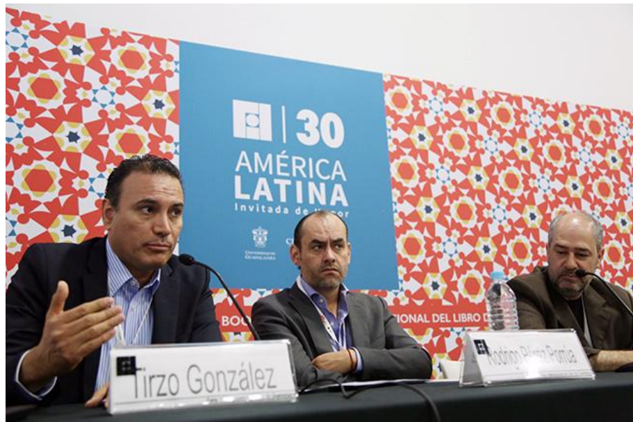
La Asociación de Librerías de México cuenta con más de 600 puntos de venta y quiere duplicarlos.

Librerías | Libros | Régimen Fiscal | Arte, Ideas Y Gente